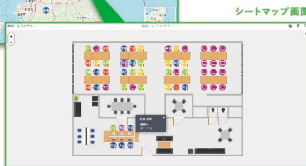
シートマップ画面